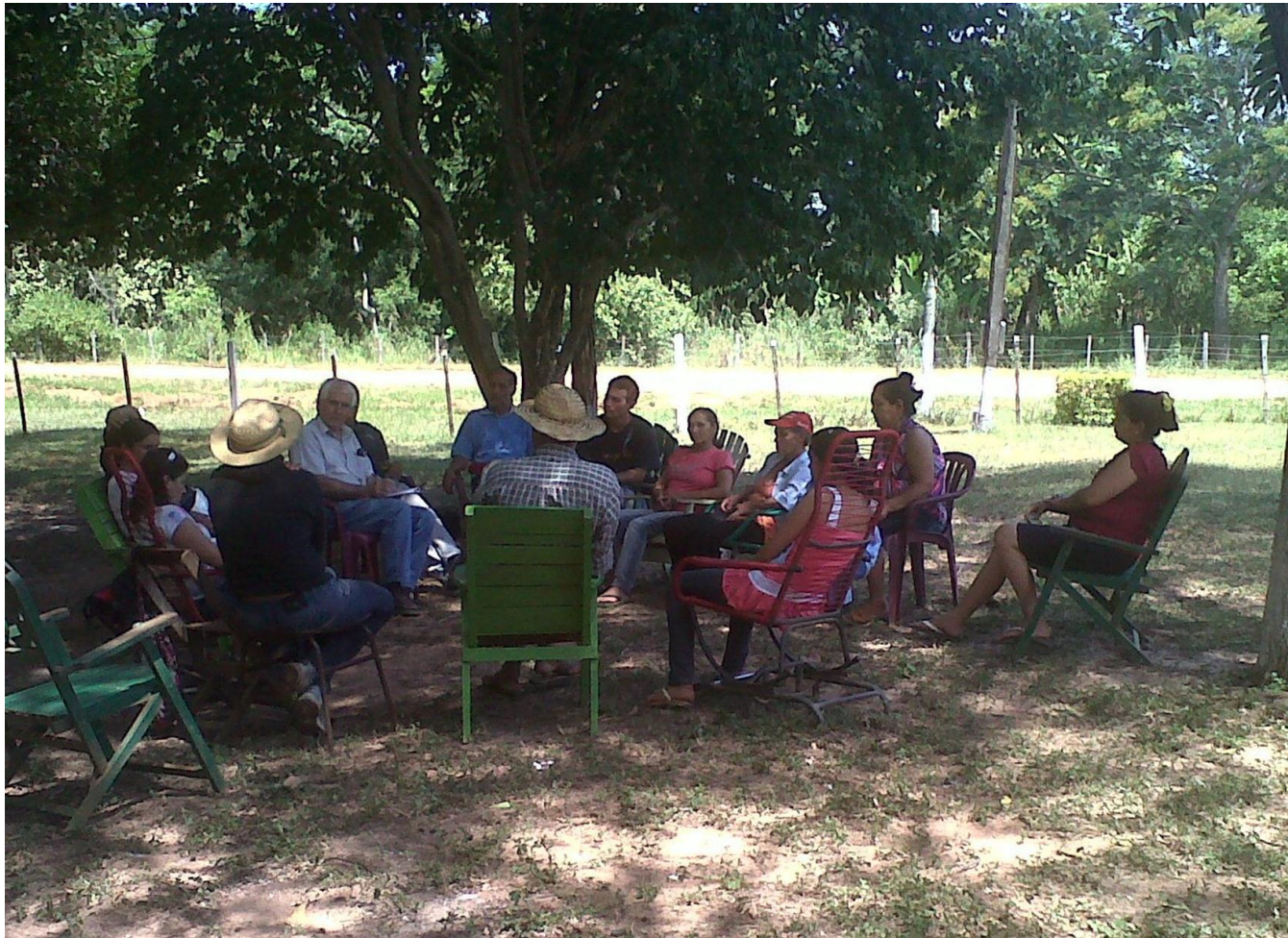
Grupo Focal en Cleto Romero, Dpto. Caaguazú